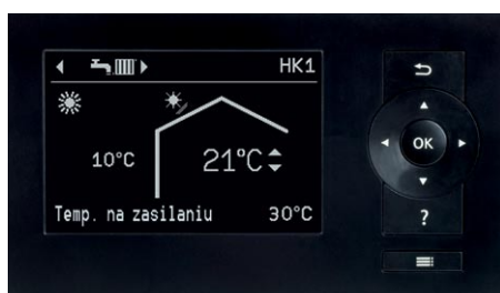
Wyświetlacz regulatora pompy ciepła Vitotronic 200