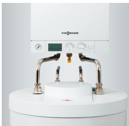
Zestaw przyłączeniowy do ustawionego pod kotłem pojemnościowego podgrzewacza ciepłej wody użytkowej Viessmann Vitocell 100-W z przewodami połączeniowymi