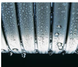
Wymiennik ciepła Inox-Radial ze stali szlachetnej odporny na duże obciążenia termiczne