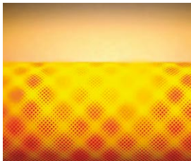
Palnik promiennikowy MatriX idealnie dopasowany do wymiennika ciepła