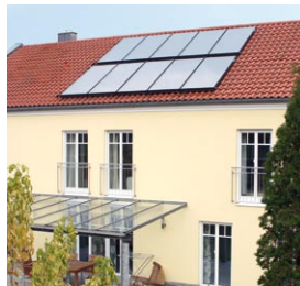
Vitosol 200-F na dachu budynku dwurodzinnego