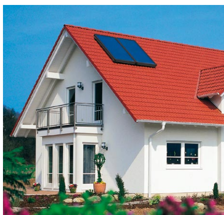
Instalacja z dwoma kolektorami Vitosol 200-F na dachu budynku jednorodzinnego

Więcej informacji o kolektorach słonecznych oraz możliwości uzyskania dotacji znajdują Państwo na stronie internetowej: