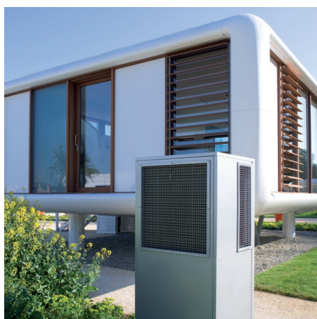
Vitocal 300-A do ustawienia na zewnątrz budynku (Silent-Version)

Poziom hałasu pracującej pompy ciepła Vitocal 300-A jest szczególnie niski w segmencie tego typu urządzeń, dzięki zastosowaniu wentylatora promieniowego z regulacją prędkości obrotowej i obniżaniu jego wydajności w trybie pracy nocnej.