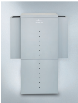
Do ustawienia na zewnątrz budynku