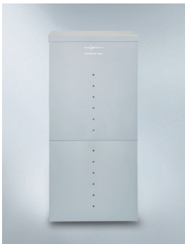
Do ustawienia wewnątrz budynku