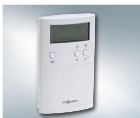
Termostat pomieszczenia Vitotrol 100 typ UTDB to komfortowe sterowanie ogrzewaniem i dodatkowe oszczędności.